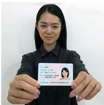
手持身份证照片示例