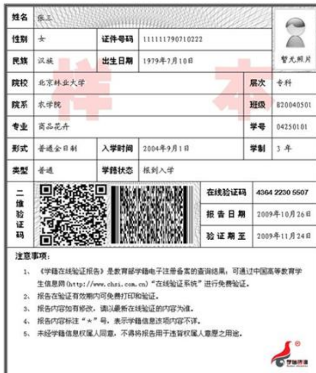
教育部学籍在线验证报告照片示例