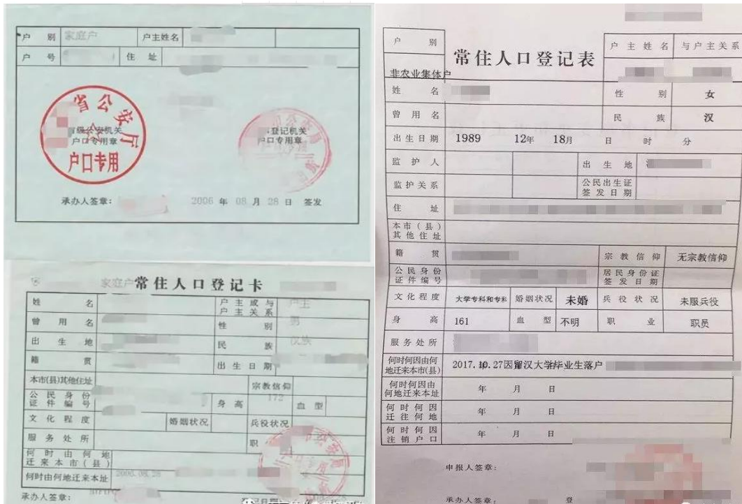
户口本与常住人口登记表示例