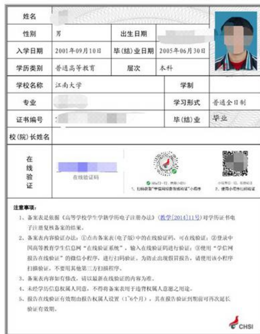
教育部学历证书电子注册备案表照片示例