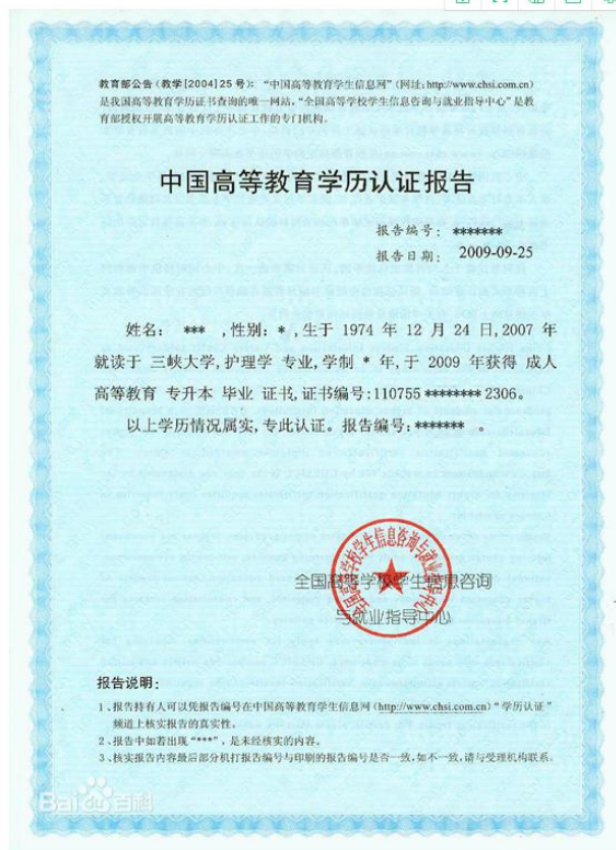
教育部学历认证报告照片示例