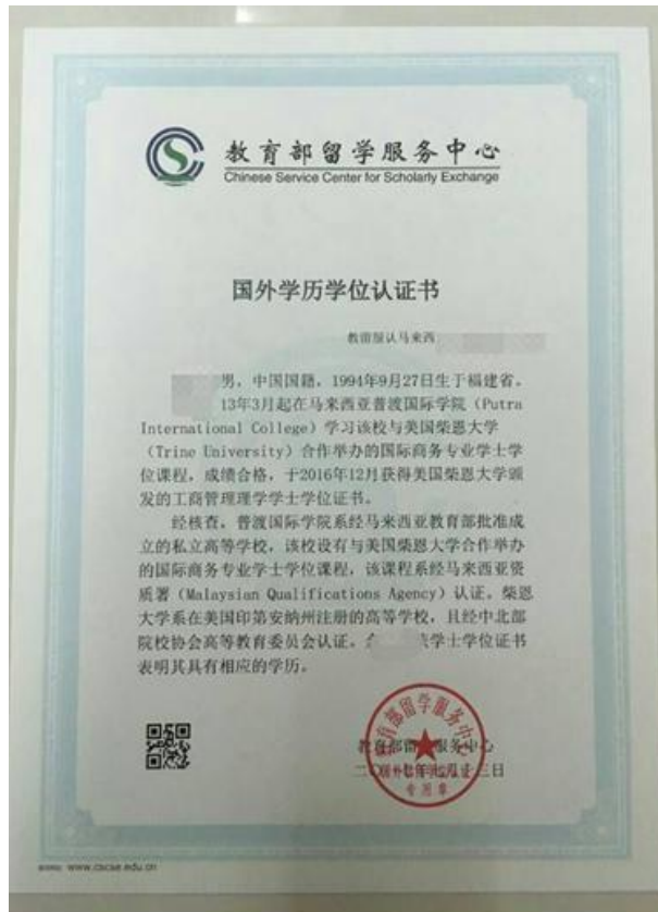
教育部留学服务中心出具的认证报告照片示例